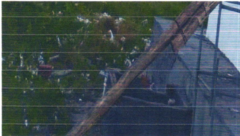
FOTO 15 - Fossa séptica pré-moldada, tipo oms, capacidade 15 pessoas ( v=900 litros)