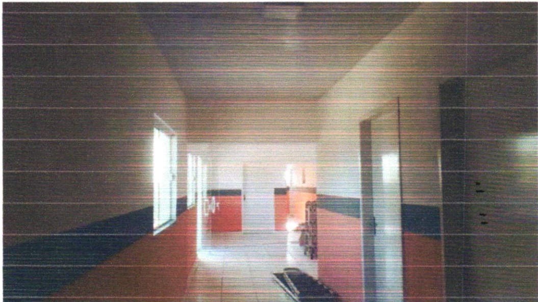
FOTO 04 - APLICAÇÃO MANUAL DE PINTURA COM TINTA LÁTEX ACRÍLICA EM PAREDES, DUAS DEMÃOS. AF_06/2