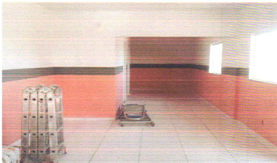
FOTO 08 - APLICAÇÃO MANUAL DE PINTURA COM TINTA LÁTEX ACRÍLICA EM PAREDES, DUAS DEMÃOS. AF_06/2014