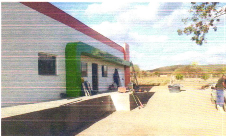
FOTO 06 - APLICAÇÃO MANUAL DE PINTURA COM TINTA LÁTEX ACRÍLICA EM PAREDES, DUAS DEMÃOS. AF_06/2014

Franklin de S. Sena Engenheiro Civil CREA-PA 051888554-2