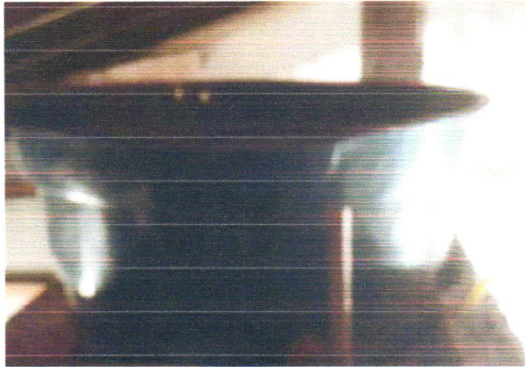
FOTO 11 - CAIXA D'ÁGUA EM POLIÉSTER REFORÇADO COM FIBRA DE VIDRO, 500 LITROS - FORNECIMENTO E INSTALAÇÃO. AF_06/2021