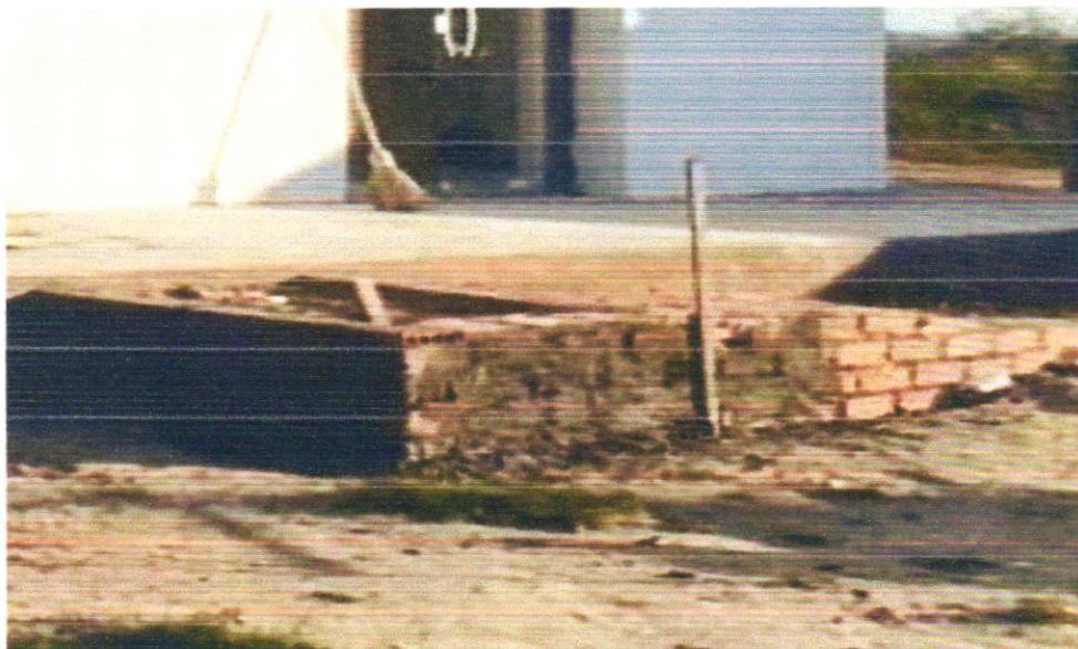
FOTO 07 - Alvenaria tijolo cerâmico maciço (5x9x19), esp = 0,05m (facão), com argamassa traço t5 - 1:2:8 (cimento / cal / areia) c/ junta de 2,0cm - R1